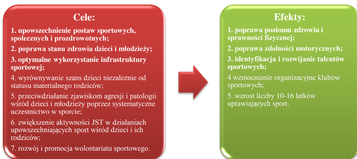
Rycina 1: Główne cele i zakładane efekty Programu „MULTISPORT”.

Program jest dokumentem otwartym, który będzie podlegał weryfikacji w momencie zmieniających się przepisów prawa lub zaistnienia warunków, których nie można było wcześniej przewidzieć.